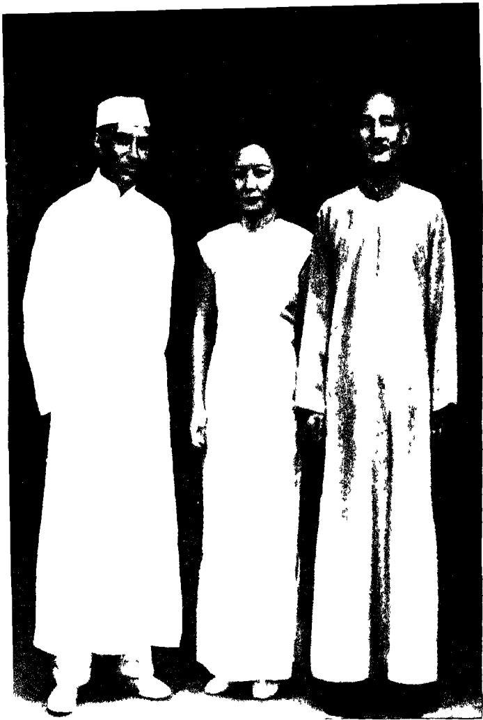
५० जवाहरलाल नहरू • चीन म मार्शल च्यांगकाई शेक और मंडम च्यांग के साथ